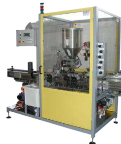
Système de conditionnement Polyprod virtualisé