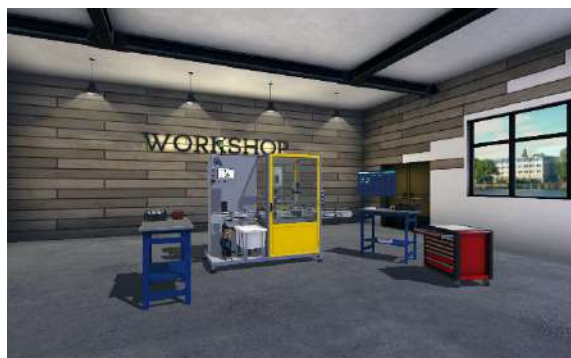
Virtual Indus avec scène 3D de pilotage de ligne de production avec le système Polyprod

Bac Pro ELEC, PLP, MEI, TISEC/TMSEC/TFCA BTS MS, FED, Electrotechnique IUT GEII, GIM, GMP