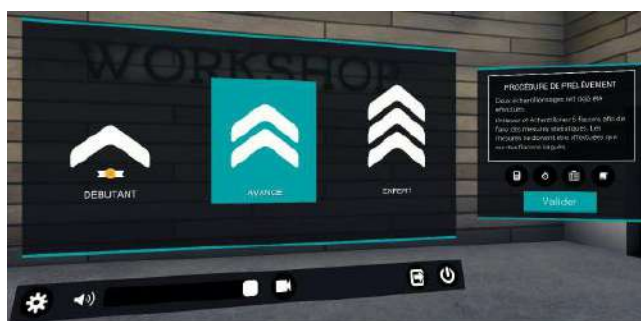
Choix du niveau : débutant, avancé ou expert