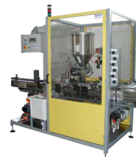
Système de conditionnement Polyprod virtualisé