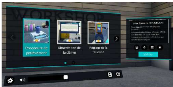
Choix de la séquence