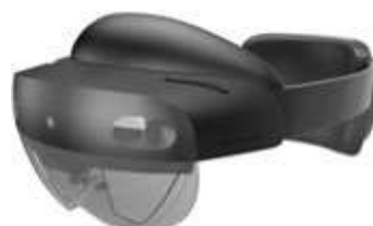
Casque de réalité mixte Hololens 2

Maintenance Industrielle Pilote de Production Electrotechnique et Energétique