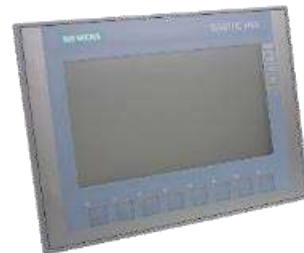
Interface Homme Machine Siemens HMI KTP700 Basic