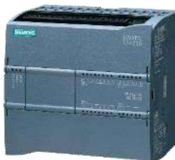
Automate Programmable Industriel S7-1200