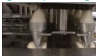
Système de remplissage en situation