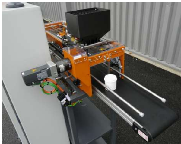
Partie opérative Dosaxe avec Module de dosage de granulés dans des pots/flacons